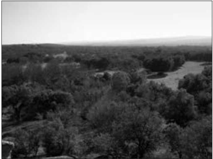
Fotografía 1. Paisaje representativo de la zona de estudio, en donde se alterna el encinar con el melojar y la fresneda.

de los nidos. Durante el periodo reproductor se visitaron desde el suelo todas las plataformas hasta poder asegurar si estaban ocupadas, o no, y a qué especie pertenecían, lo que generalmente implicaba una media de 2,5 visitas por plataforma. Se consideró que un nido estaba ocupado cuando se comprobaba la presencia de adultos incubando, pollos en el nido o se veía jóvenes voladeros o adultos en actitud defensiva en el entorno inmediato de un nido activo, es decir con aportes de ramas frescas, restos de presas y deyecciones. En ocasiones no se pudo encontrar el nido, pero se estimó la presencia de una pareja por los comportamientos descritos en la metodología propuesta por Viñuela et al. (1999). En la primera temporada del estudio, 2007, solo se pudieron censar 610 ha, cubriéndose la totalidad del territorio a partir de 2008.