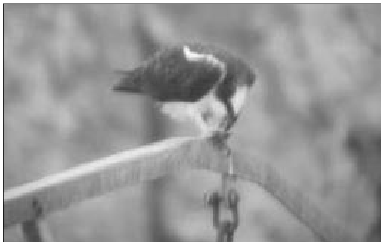
Águila Pescadora ( Pandion haliaetus ) en la confluencia de los ríos Manzanares y Jarama el 3 de abril.