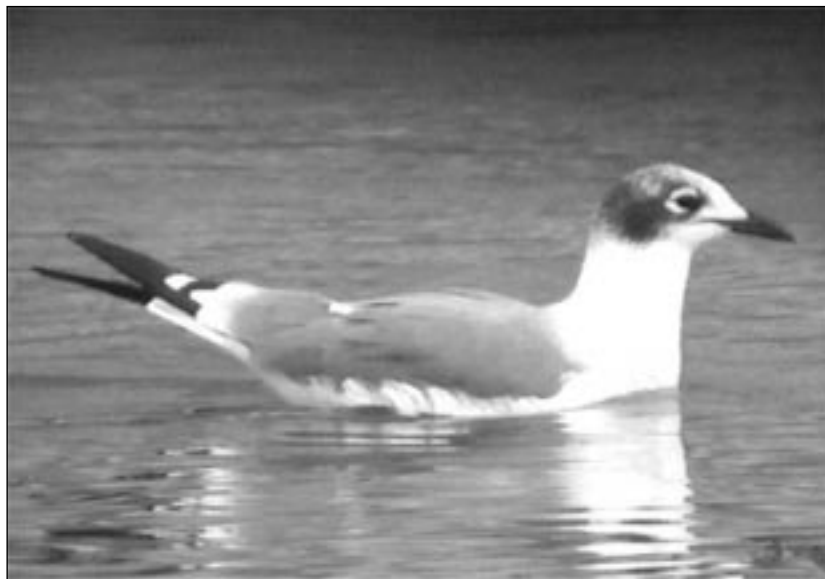
Gaviota Pipizcan ( Larus pipixcan ) de segundo invierno observada en la Presa del Rey el 13 y el 14 de septiembre.