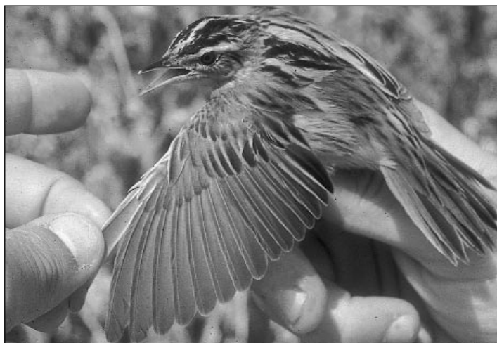
Carricérin Cejudo ( Acrocephalus paludicola ) joven capturado para anillamiento en el carrizal de Los Albardales el 31 de agosto.