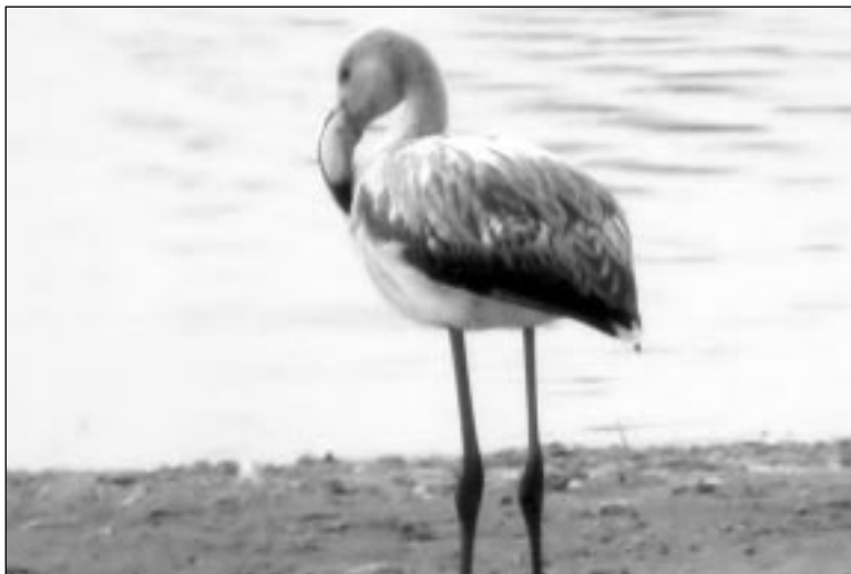
Flamenco Común ( Phoenicopterus roseus ) juvenil en la laguna Soto Mozanaque el 28 de septiembre.