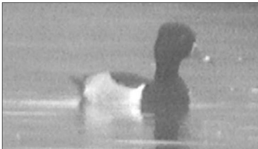
Macho de Porrón Acollarado ( Aythya collaris ) observado en las graveras de El Porcal el 6 de enero.

- Primera cita para Madrid: Rivas-Vaciamadrid, gravera de El Porcal, la más cercana a RNE, 1 m. ad. observado