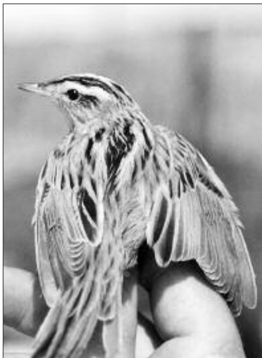
Carricerín Cejudo ( Acrocephalus paludicola ) capturado en la Estación de Anillamiento de Las Minas el 19 de agosto.