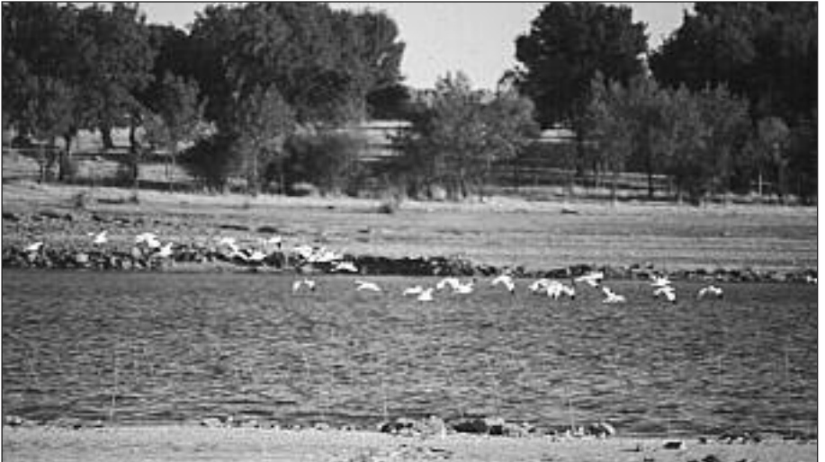
Grupo de avocetas comunes ( Recurvirostra avosetta ) en el embalse de Santillana el 21 de agosto.

- San Martín de la Vega, Soto Gutiérrez, 4 ind. en laguna de inundación del río Jarama el 22.III (R. Moreno-Opo).