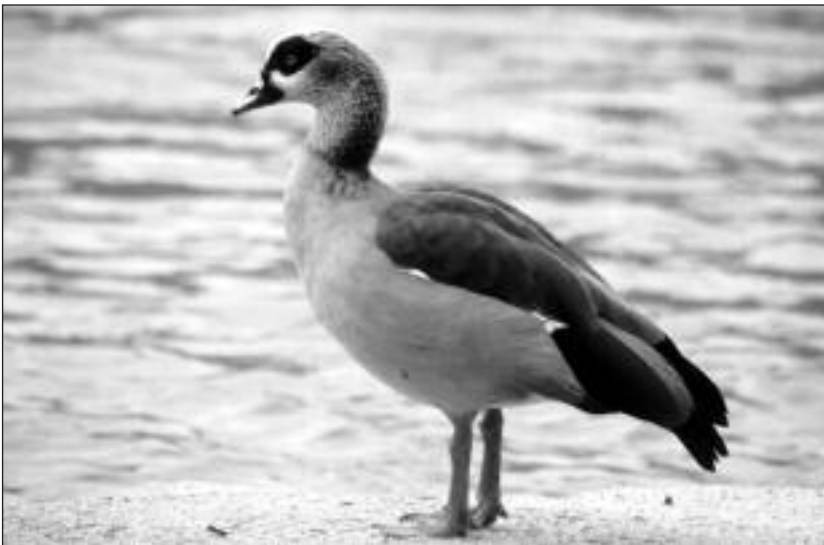
Ganso del Nilo ( Alopochen aegyptiacus ) junto a la Presa del Rey el 18 de diciembre de 2000.

Criterio : todas las citas recibidas. Esta especie se va a excluir a partir del año 2003 del Listado de Rarezas (De Juana y Comité de Rarezas de la SEO 2002). Por ello, las observaciones que se realicen a partir del 1 de enero de 2003 no deberán enviarse a dicho comité. No obstante, para los años 2001 y 2002 las observaciones precisan ser revisadas por el Comité de