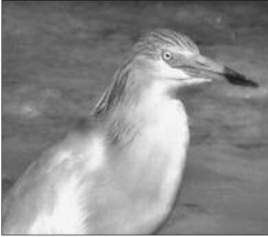
Garcilla Cangrejera ( Ardeola ralloides ) en la laguna artificial Soto Mozanaque el 7 de julio.