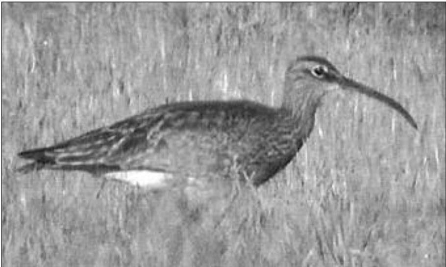
Zarapito Trinador ( Numenius phaeopus ) junto al embalse de Santillana el 6 de mayo.