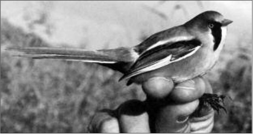
Macho de Bigotudo ( Panurus biarmicus ) capturado en la laguna de San Juan el 3 de noviembre

- Madrid, Estación de Anillamiento de Barajas, primera captura en paso postnupcial el 31.VIII y última el 2.X (SEO-Monticola).