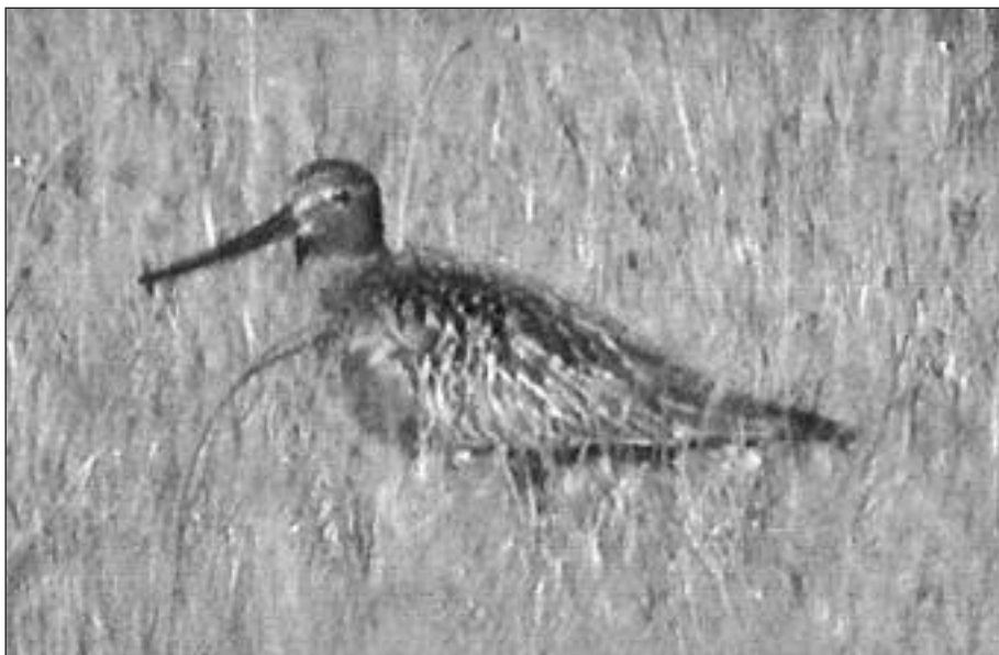
Aguja Colipinta ( Limosa lapponica) junto al embalse de Santillana el 6 de mayo.