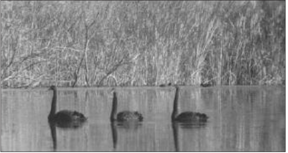
Cisnes negros ( Cygnus atratus ) en la gravera de El Campillo el 13 de diciembre.