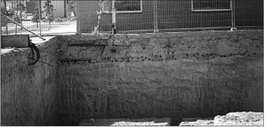
Colonia de Avión Zapador ( Riparia riparia ) establecida en Villanueva del Pardillo durante la primavera (foto: D. Serrano).

Viñuelas el 18.II y publicada en el AOM 1999, corresponde al año 1998 y ya se publicó en el AOM 1998.