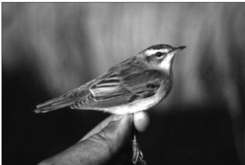
Carricero Común capturado en la Estación de Anillamiento de Las Minas.