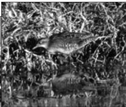
Polluela Chica vista en el Parque de La Polvoranca los días 30 de octubre y 3 de noviembre.