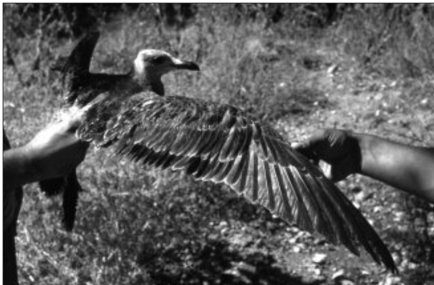
Gaviota de Audouin trapeada para anillamiento en el basurero de Colmenar Viejo el 26 de agosto.