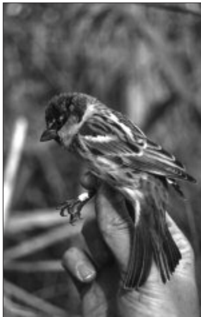
Gorrion Moruno capturado en la Estación de Anillamiento de Las Minas. (foto: A Bermejo/ J. de la Puente).

- Primera cita para Madrid: Mejorada del Campo, Las Islillas, 1 ind. capturado para anillamiento con un bando de Bengalí Rojo (J.A. López Septiem y J. Rueda).