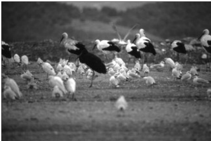
Cigüeña Negra en el vertedero de Valdemingómez, 7 de enero de 1996